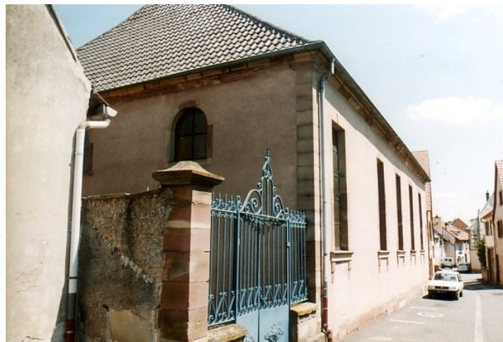
ehemaliges Synagogengebäude in Marmoutier