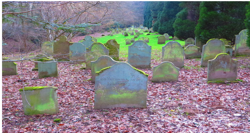
jüdisches Begräbnisareal in Marmoutier

Auf dem jüdischen Begräbnisareal - es wurde bis in die jüngste Vergangenheit belegt - findet man ca. 500 Grabsteine; der älteste Stein datiert von 1799.